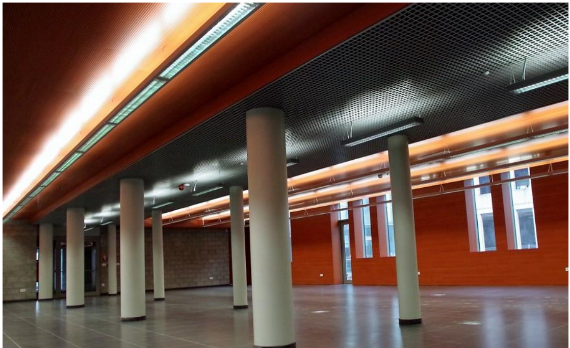
Fot. 4 – pomieszczenia Biblioteki - wypożyczalnia główna