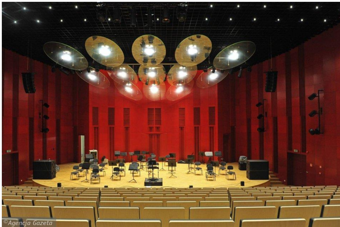
Fot. 1 – sala koncertowa