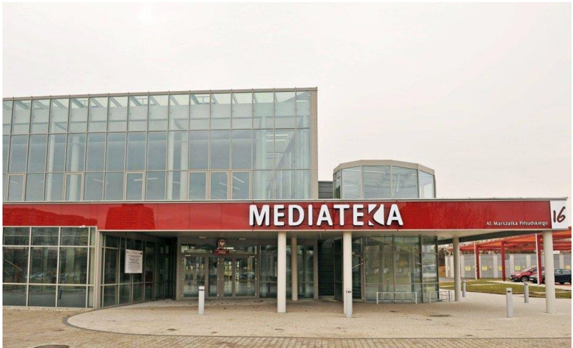
Fot. 3 – widok wejścia głównego od strony elewacji północnej